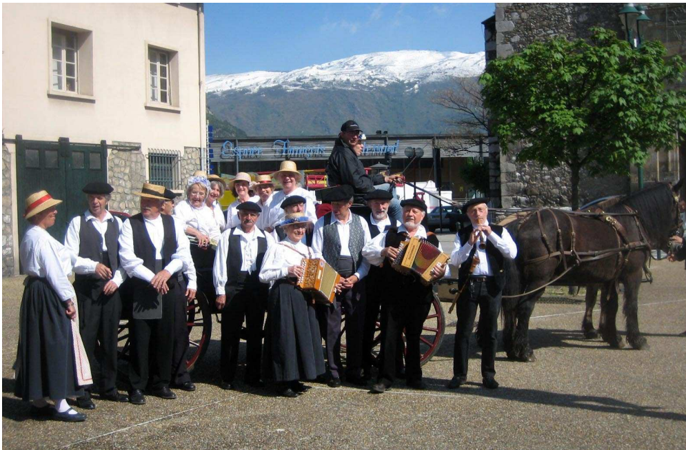
Les danseurs et musiciens biertois ont participé samedi 8 mai 2010 à la foire de Tarascon. À cette occasion, ils ont "inauguré" avec plaisir leur nouveau répertoire 2010.